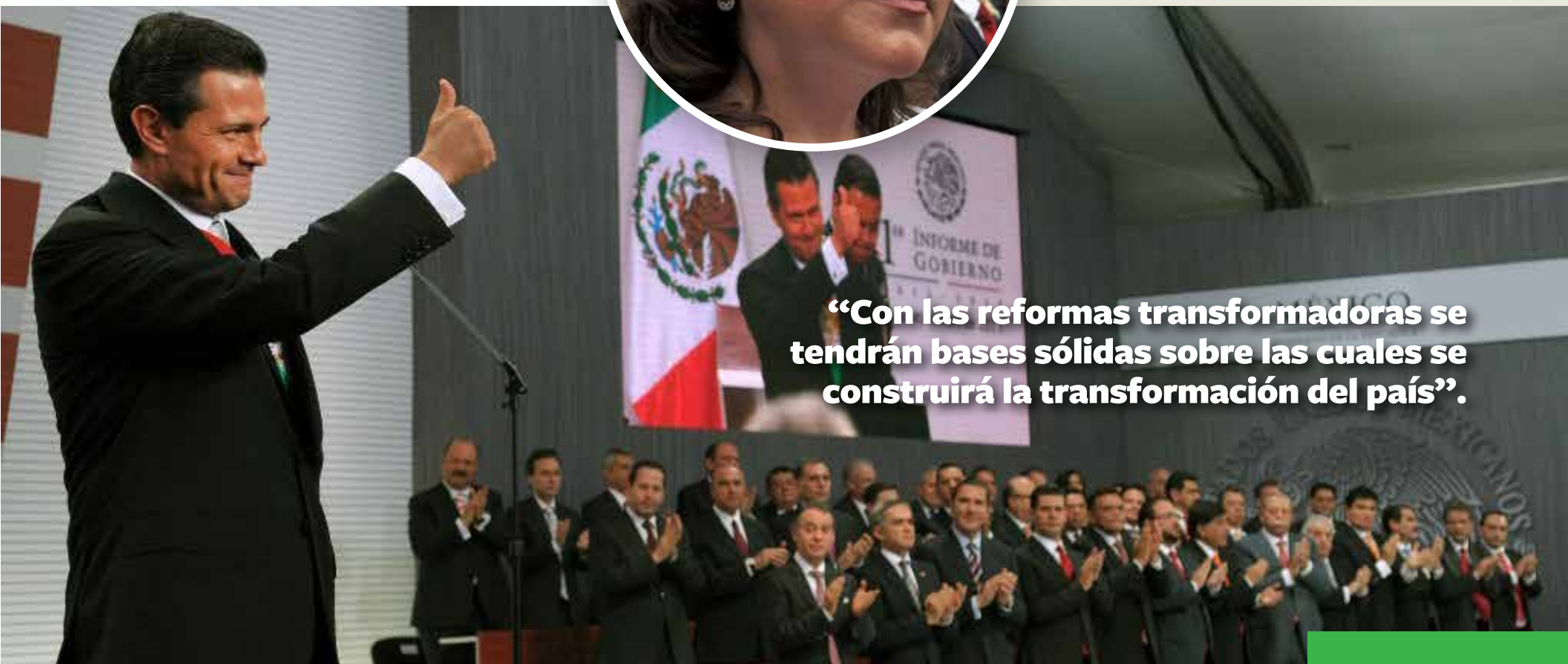
Ivonne Ortega Secretaria General del CEN

“Con las reformas transformadoras se tendrán bases sólidas sobre las cuales se construirá la transformación del país”.